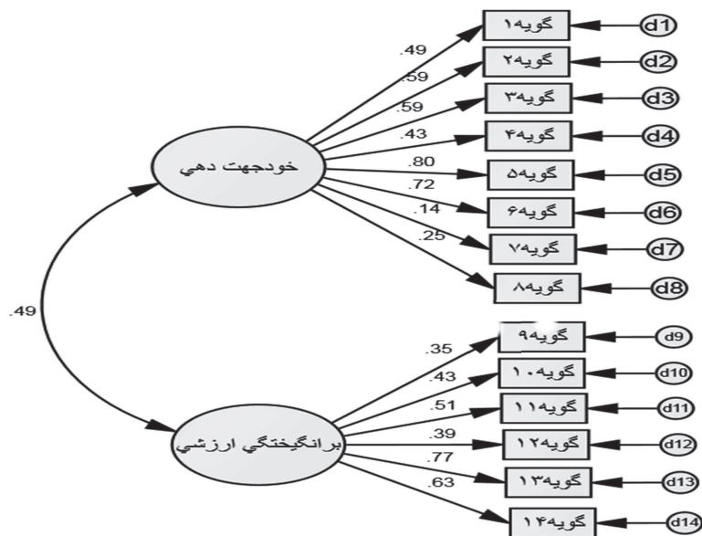
شکل ۲. بارهای عاملی استاندارد مدل دو عاملی مرتبه‌ی اول مقیاس نگرش‌های مسیرشغلی متنوع