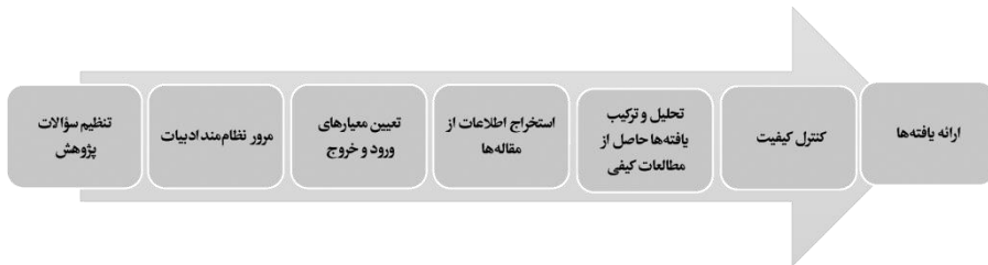
شکل ۱. مراحل و روش کلی فرا ترکیب ساندلوسکی و باروسو (۲۰۰۷)

به طور فرعی به این موضوع پرداخته اند، تهیه شد. در مرحله دوم، چکیده این مقالات استخراج و مقالات دسته بندی، و در مرحله سوم با استخراج عناصر کلیدی، ترکیب نهایی انجام شد و تحلیل و جمع بندی صورت گرفت. مراحل و روش کلی هفت مرحله ای فرا ترکیب در شکل ذیل آورده شده است: